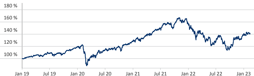
— CONREN - Generations Family Business Equity - I A