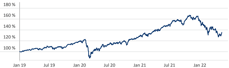
— CONREN - Generations Family Business Equity - I A